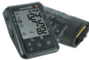
BP B6 Connect