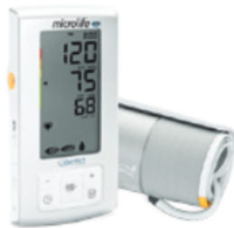
BP A6 PC