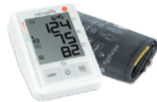
BP B3 AFIB