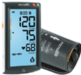
BP A7 Touch BT